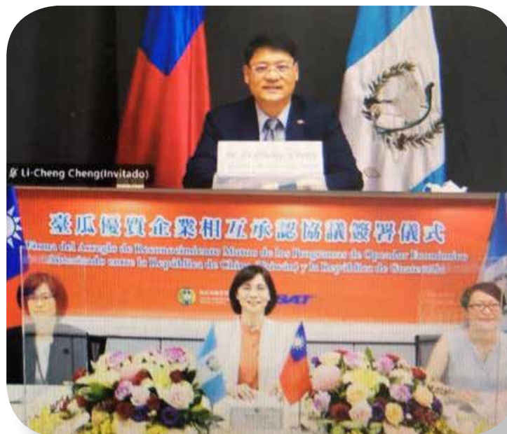
Guatemala, mayo 2021